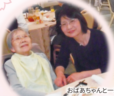
おばあちゃんと一緒に 食事が出来て嬉しい。