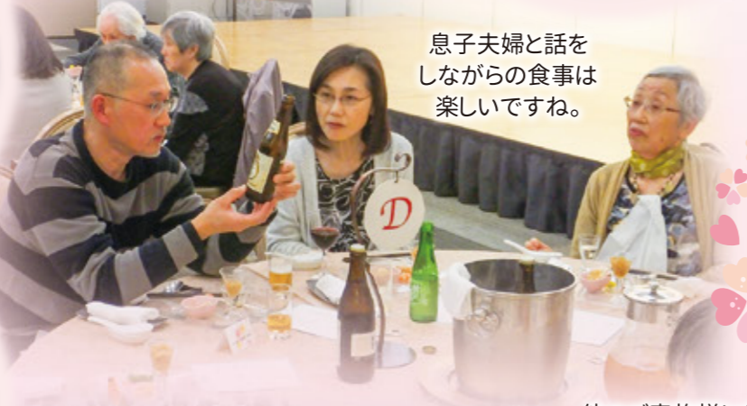
息子夫婦と話を しながらの食事は 楽しいですね。