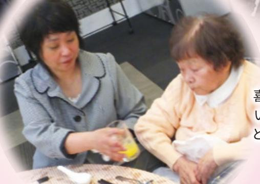
喜んで食べて いる姿を見て とてもうれしく 思います。