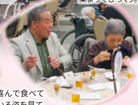
こんなに大勢 集まってびっくり。