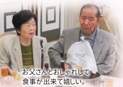
お父さんとおしゃべりして 食事が出来て嬉しい。