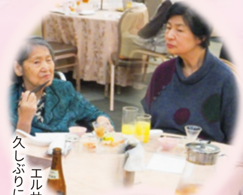
久しぶりに エルサンに 来ました。