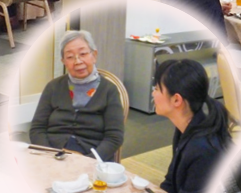
いつもお世話になっている 職員の方と お話が出来て 参加して良かった。