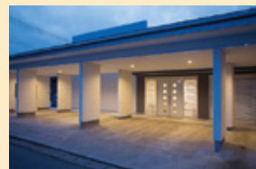
デイサービス アブラ ☎0235-64-0302 鶴岡市稲生一丁目4-53