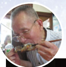
いいずん 朝日 タキタロウ館