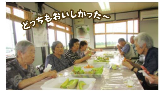
西郷メロンの食べほうだい!