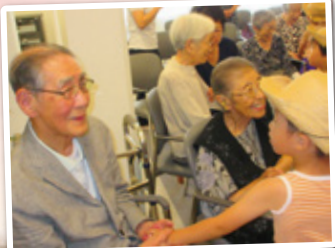
ちとせ保育園の 園児 元気いっぱいの 踊りに笑顔満開