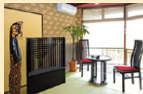
エタニティハウスひまわり ☎0235-25-5160 デイサービス いいずん ☎0235-64-0604 鶴岡市稲生一丁目3-45