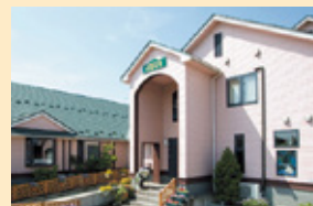
居宅介護支援事業所・訪問介護事業所 アメニティハウスひまわり グループホームひまわり ☎0235-25-5145 鶴岡市稲生一丁目3-5

株式会社ひまわり ☎0235-25-5145 www.himawari-s.co.jp 〒997-0834 山形県鶴岡市稲生一丁目3-5 アメニティハウスひまわり2F