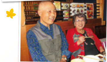
「とがし肉家」で焼肉