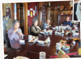
鼠ヶ関の「朝日屋」でお寿司