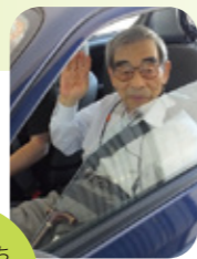
今日はどちらへお出かけですか…

出かけたい時に出かける。運動したい時に運動する。毎日が自由な時間。スケジュールを自分で決め、心地よい一日がスタートします。「一日一笑」今日も笑顔で暮らします。