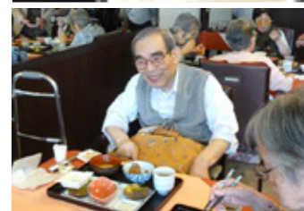
▲食事を囲んで和やかに