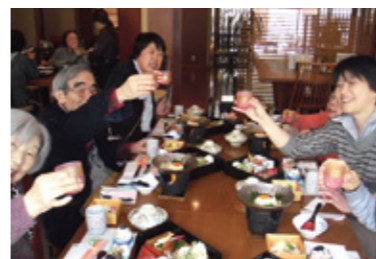
▼いろんなところへ行きましたね